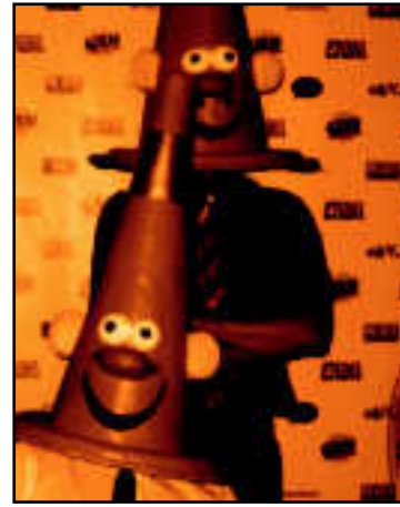
SOBADORES. Una alternativa con estética propia, alejada de tópicos.