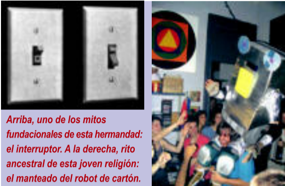
Arriba, uno de los mitos fundacionales de esta hermandad: el interruptor. A la derecha, rito ancestral de esta joven religión: el manteado del robot de cartón.

uno de los fundadores de la colonia Siglo XX. "Casi todos nosotros trabajábamos antes para grandes multinacionales. Nos empezaron a apretar las tuercas con el efecto 2000 (YK2): jornadas extenuantes y amenazas constantes sobre la llegada del Apocalipsis Informático y económico día sí, día también. Empezamos a compartir nuestro descreimiento hacia el "efecto" y hacia el propio sistema que nos venía alimentando. En vez de mandarnos entre nosotros 100 powerpoints chorras cada mañana empezamos a preguntarnos qué pasaría si lo mandáramos todo a tomar por saco y nos fuésemos con nuestros primeros Amstrad y Spectrum a cualquier pueblo perdido, a currar por nuestra cuenta."