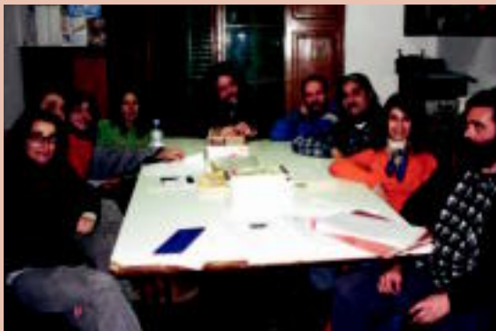
Ateneu Llibertari Estel Negre

2. Entre los objetivos a corto plazo que tenemos están materializar una serie de proyectos editoriales que tenemos en marcha (tanto publicaciones como audiovisuales) y a medio y largo plazo, preparar las próximas Jornadas Libertarias enmarcadas en la celebración del 20 aniversario del Ateneu, por lo que intentaremos que sean sonadas. Un objetivo que curiosamente es a corto y largo plazo es la salvaguarda de la tierra; Mallorca está, lo podéis creer, en peligro de extinción, fuertemente amenazada por el capitalismo salvaje e inculco, que sólo piensa en la satisfacción inmediata y no mira el futuro, un futuro que si no luchamos no habrá.