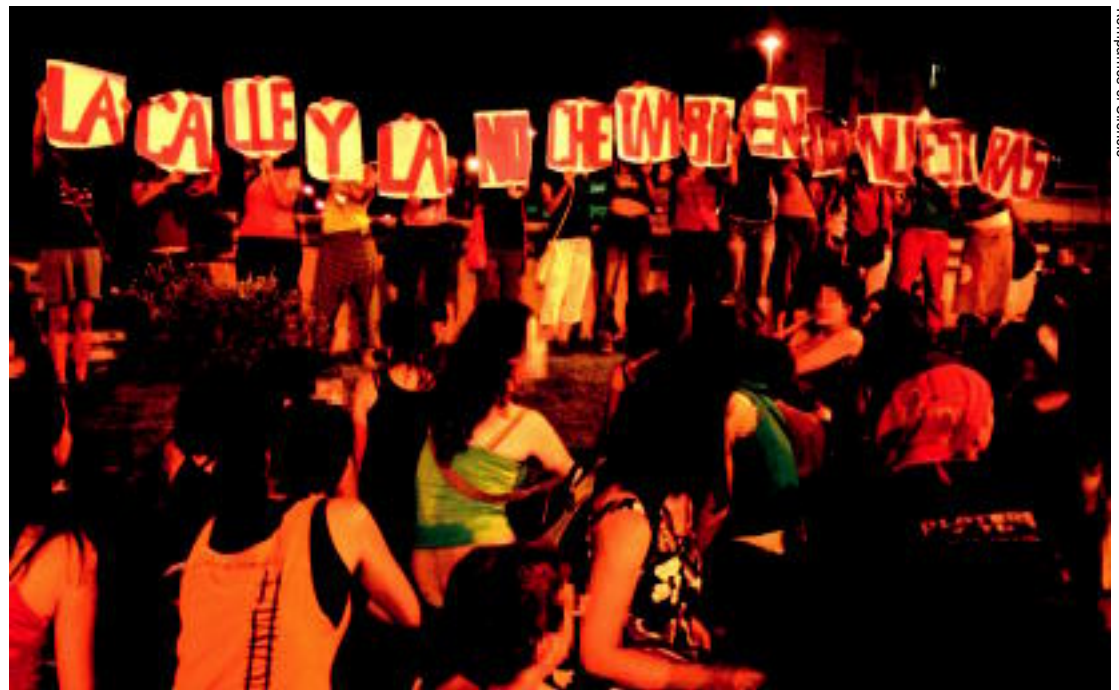
Rompamos el Silencio

"LA CALLE Y LA NOCHE TAMBIÉN SON NUESTRAS". El eje de antipatriarcado intervenía con esta acción en la madrugada del 30 al 1 de julio. Un centenar de activistas visibilizaban los espacios donde las mujeres se pueden sentir amenazadas.