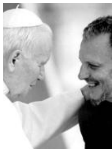
PROMOTOR. Juan Pablo II y el fundador de los 'kikos', Kiko Argüello.

Legionarios de Cristo, creado en 1941 en México por Marcial Maciel y con implantación en el Estado español desde los '80, tiene su referencia educativa en la Universidad