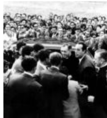
LA OBRA. Escrivá de Balaguer en una visita al Colegio Tajamar del Opus Dei.