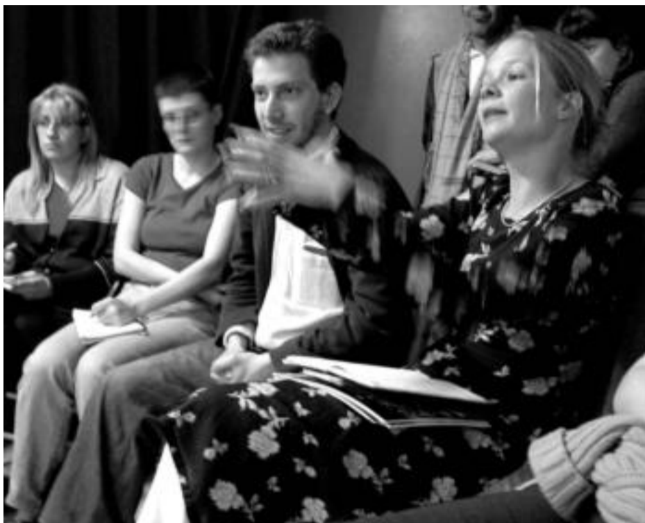
OPRESORES Y OPRIMIDOS. "Sólo están definidos en relación a situaciones concretas; no son esencias".

J.B.: Si queremos luchar contra las violencias estructurales, hay que ser muchos. La figura del tritagonista, para mí, es el espectador pasivo representado en escena, la persona que se contenta con el sitio en el que está, con el lugar que le ha destinado la sociedad, y a la que habría que