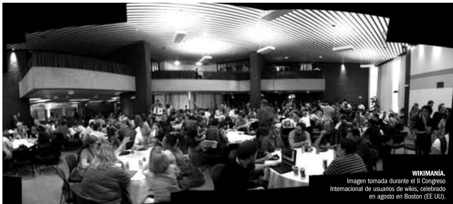
WIKIMANIA. Imagen tomada durante el II Congreso Internacional de usuarios de wikis, celebrado en agosto en Boston (EE UU).

ción. Este verano se ha celebrado en Boston el II Congreso Internacional Wikimania, donde unas 400 personas se reunieron para fortalecer los vínculos entre estos proyectos telemáticos.