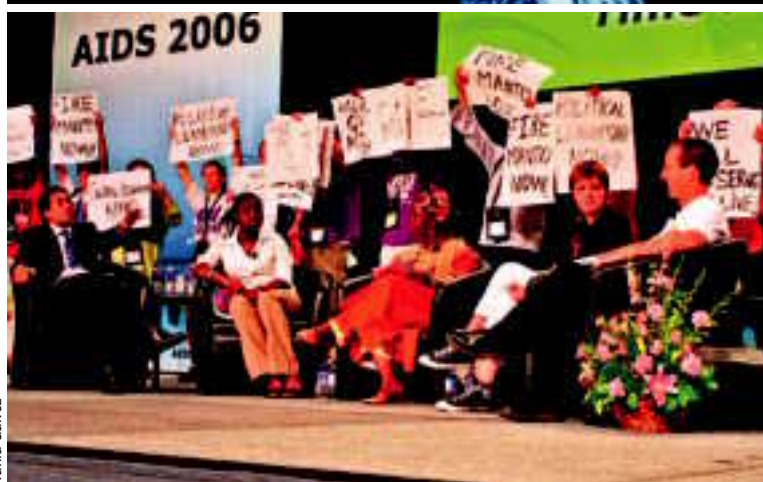
BUSCAR SOLUCIONES. A 25 años de la aparición de la epidemia, los activistas en la lucha contra el VIH denuncian los frenos para que no se activen mayores políticas de prevención. Arriba, foto, una mujer enseña en una escuela a colocar un preservativo.

mujeres imposibilitadas para la negociación del uso del preservativo, personas que ejercen la prostitución y hombres que se relacionan sexualmente con hombres a los que no llegan los programas para impulsar comportamientos sexuales seguros. Está claro que estas formas de prevención están basadas, por un lado, en la negación a trabajar por paliar los da-