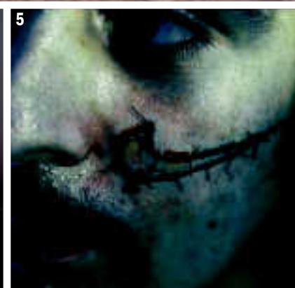
CRÍTICA EN ACCIÓN. 1 y 5: 'Photo op', de Peter Kennard y Cat Piction Phillipps. 2: 'Stencil' de Banksy en el muro de Palestina. 3: Pintada callejera en Barcelona. 4: Intervención del Colectivo El Perro.

CONTRAPUBLICIDAD: EXPRESIONES GRÁFICAS DISIDENTES