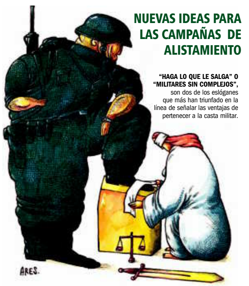
"MOSTRAR EL LADO HUMANO DEL EJÉRCITO". Esta es la filosofía del grupo de publicistas que luchan por terminar de una vez con la imagen antipática de las FF AA.