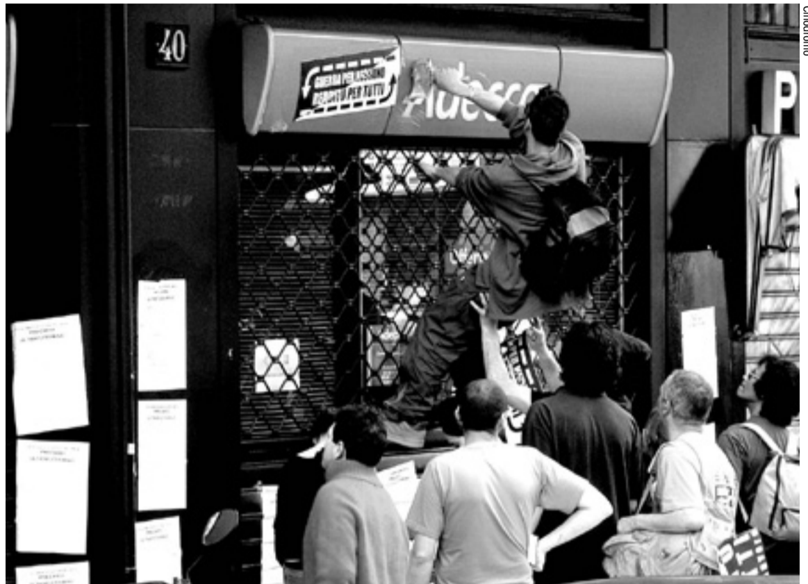
LOS ESTUDIANTES CONTRA ADECCO. Los manifestantes cubrieron las fachadas de las principales agencias de trabajo temporal que encontraron a su paso durante el MayDay de 2004 celebrado en Milán.

F.: Con el Santo de la Precariedad hacemos lo que se llama subvertising (técnica de desvío y reapropiación del propio lenguaje de la publicidad para generar un efecto de sentido opuesto o diferente) sobre un tejido social que es muy católico. Aunque seamos laicos, en Italia hay un pasado popular ultracatólico. El santo fue tomado de la cultura popular para insertarlo en una situación no religio-