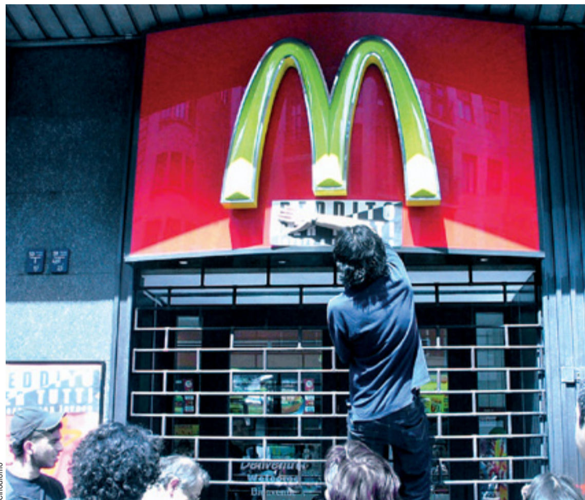
RONALD MCDONALD ES FEO. Acción de los 'chainworkers' en un McDonald's, el lugar del que proceden muchos de ellos.