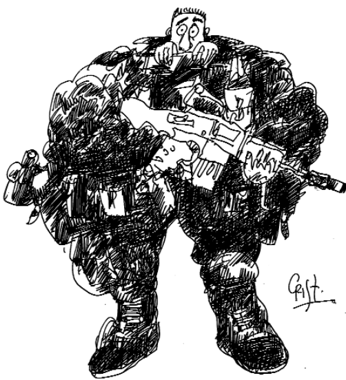
FORMACIÓN DE SOLDADOS IRAQUÍES. Además de aumentar la ayuda económica, la Unión Europea participará en la formación de 1.500 militares y altos cargos.

"Es necesario, para proteger la seguridad de los EE UU, que se limiten las concesiones de los pri-