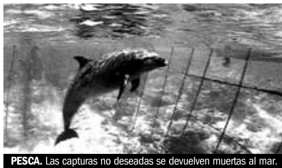
PESCA. Las capturas no deseadas se devuelven muertas al mar.

Lejos de adaptar sus flotas a los recursos, la UE ha dedicado ingentes fondos a subsidiar la construcción de imponentes barcos como el Alakrana, dedicados a la pesca industrial (este buque recibió 4.272.960 de euros para su construcción). Estos barcos, tan necesitados de subvenciones, que la UE proporcionó hasta 2004, tienen otro defecto económico: para ser rentables necesitan un gran volumen de captura. Disponen de medios para llevarla a cabo: radares que