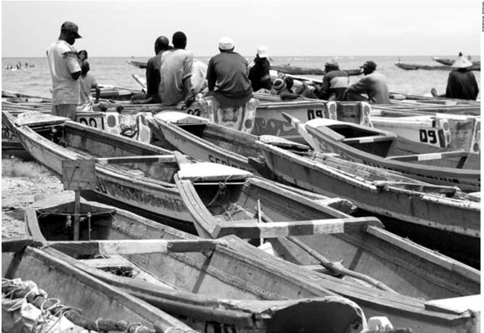
SENEGAL. 600.000 senegaleses se dedican a la pesca. Su actividad se ha visto perjudicada por la pesca industrial, gestionada por empresas europeas y asiáticas.

Seis años después, los acuerdos de pesca de Santo Tomé y Mauritania han sido renovados. Sin embargo, Angola y Senegal se nega-